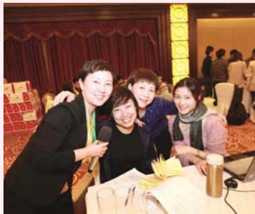
2013年1月27日,上海电院电气设备有限公司、上海电院电力电子实业有限公司、上海浦海求实电力新技术有